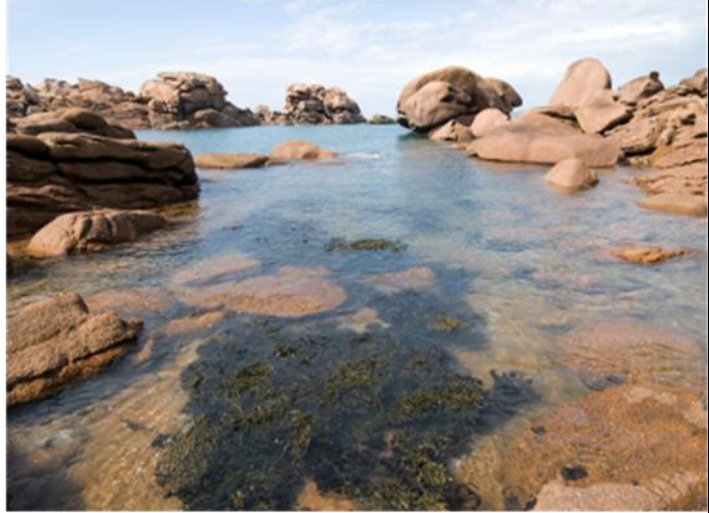
منظر لصخور الكرانيت.