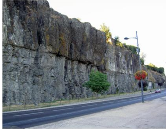
منظر عام لصخور البازلت

صخرة داكنة، صلبة خشنة كثيفة. تحتوي على بلورات كبيرة (الأوليفين والبيروكسن) وعلى عجين.