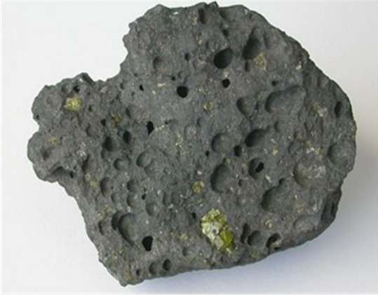
عينة من صخرة البازلت

1- ملاحظة عينات من صخرتي البازلت والكرانيت بالعين المجردة.